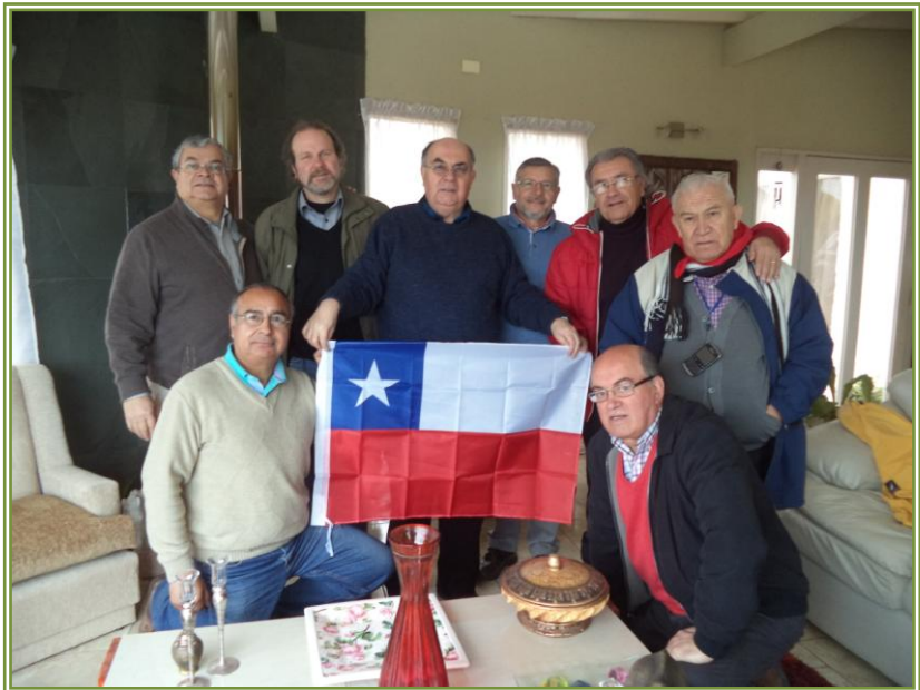
Hermanos Abracadabra, Gato Oceánico, Cástor, Nautilus, Letal (con quien no se pasa mal), Coke, muchacho Reinoso y TBC.