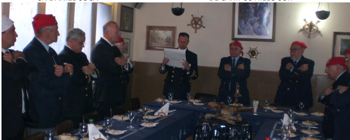
LECTURA DE LA ORACIÓN AL MAR EN LA SEGUNDA CUBIERTA