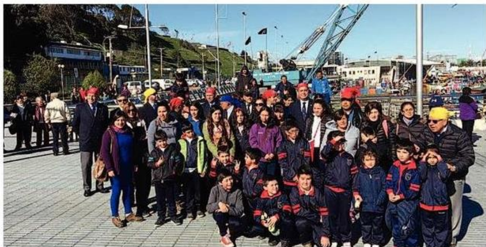
LOS NIÑOS ESTABAN FELICES DE REALIZAR ESTA VISITA AL PUERTO DE SAN ANTONIO.