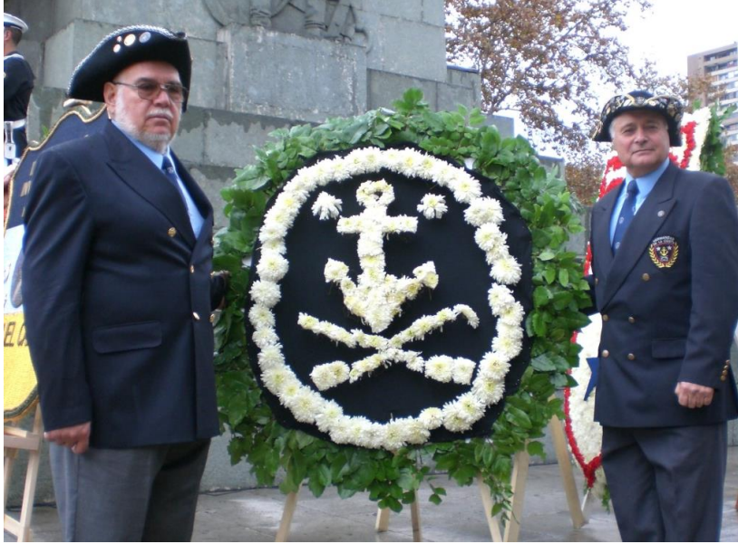
OFRENDA FLORAL EN EL MONUMENTO A PRAT EN SANTIAGO

21 de mayo