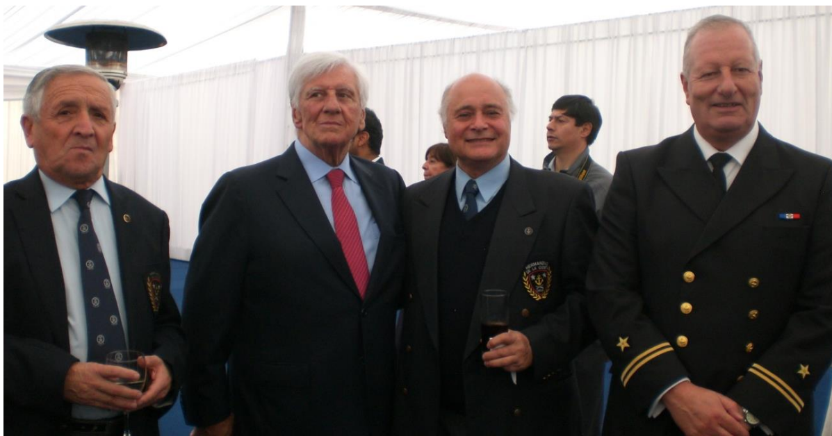
CON EL ALCALDE DE LA COMUNA DE VITACURA RAUL TORREALBA