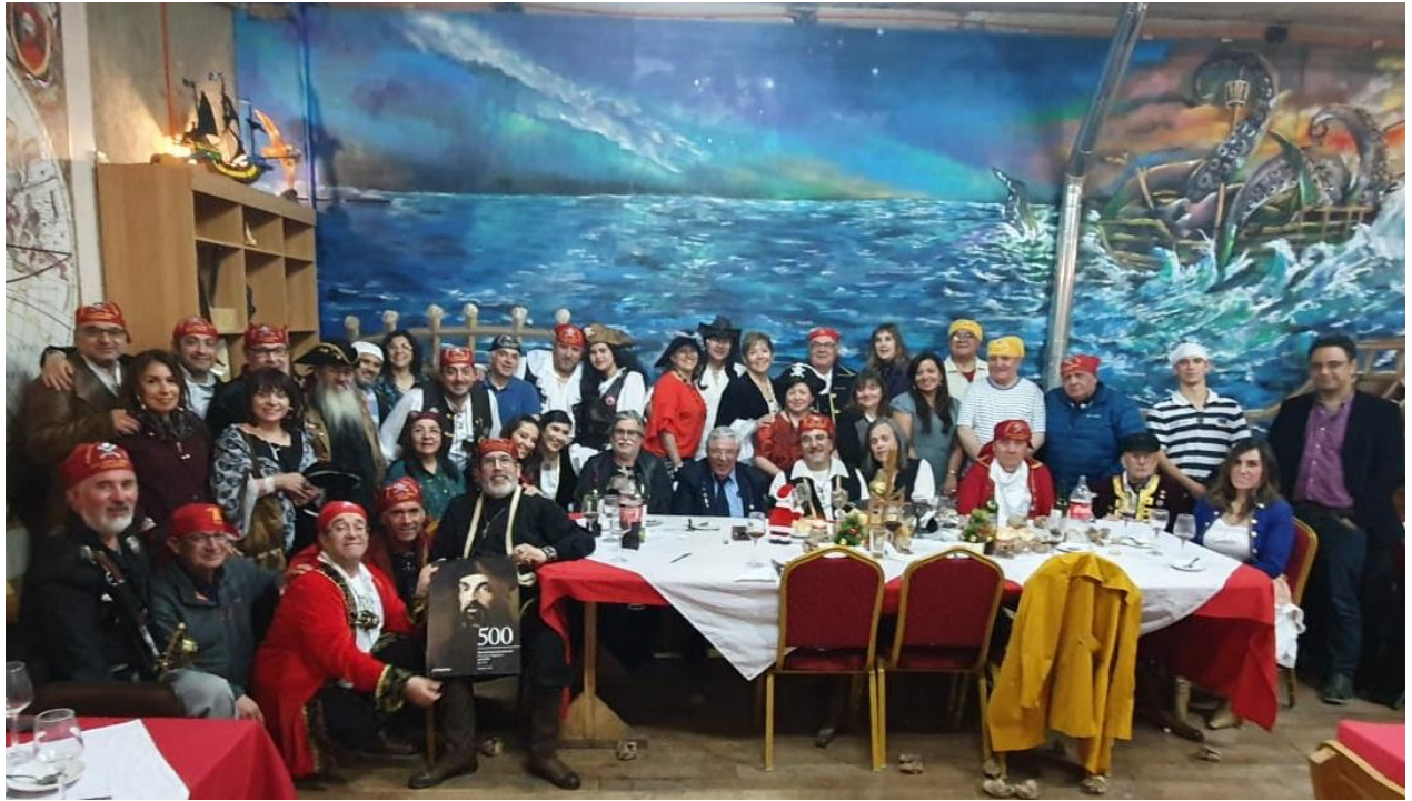
Zafarrancho en la nao de los 50 Bramadores de Punta Arenas,