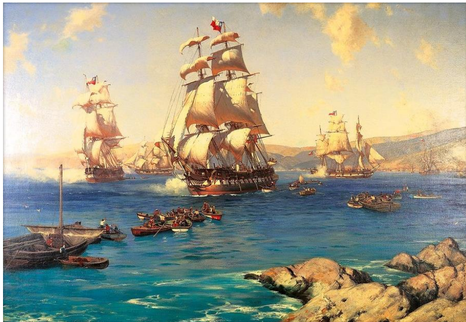
1820 el zarpe de la escuadra libertadora, pintura al óleo de marinas de Thomas Somerscales, perteneciente al Museo Naval de Valparaíso