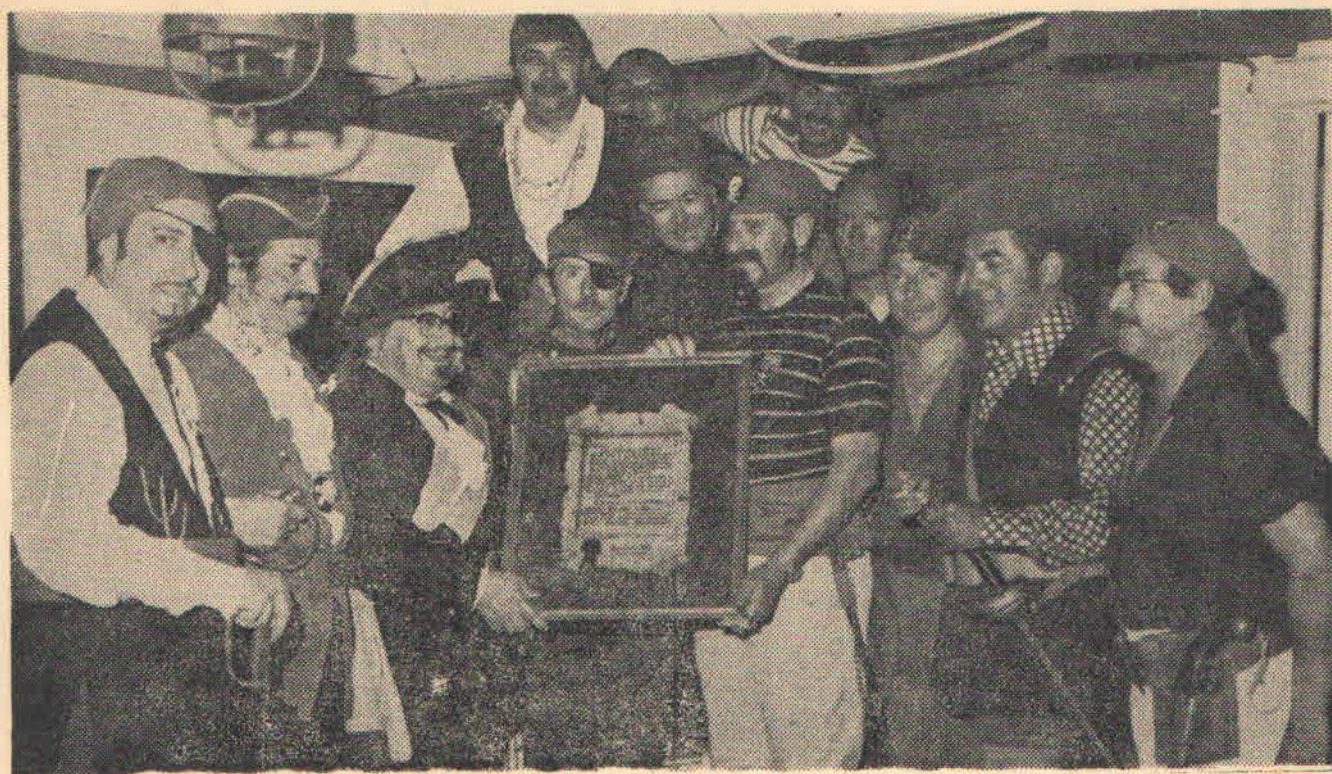
Zafarrancho de combate de la Mesa de Antofagasta, Navidad del Mar.