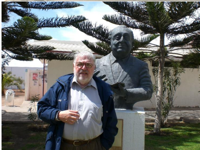
Busto de Andrés Sabella en la Universidad Católica del Norte, Antofagasta