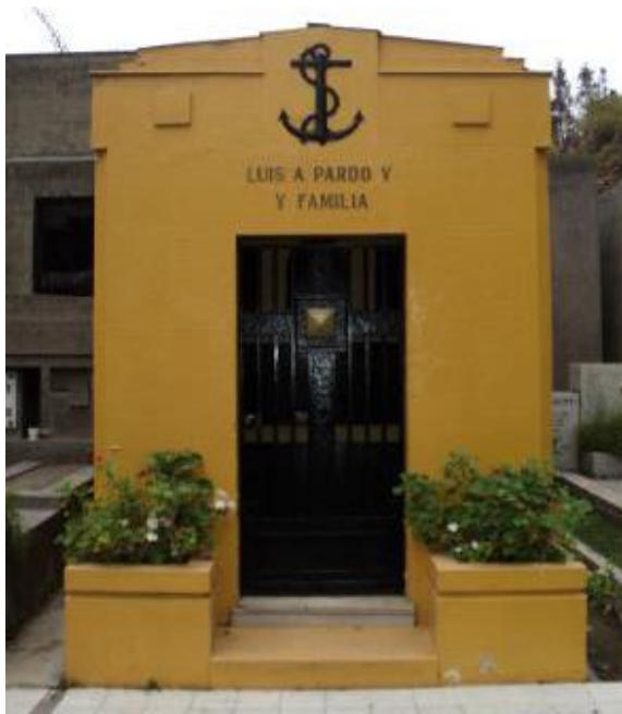
Mausoleo del piloto Pardo en el Cementerio General Fallece en Santiago el 21 de febrero 1935 a los 52 años