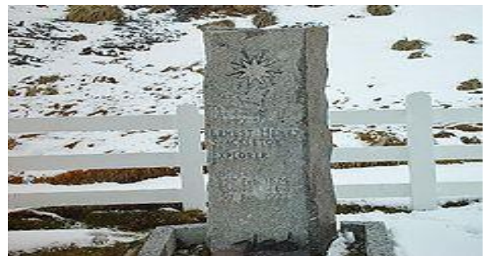
Tumba de Shackleton en Grytviken, Georgia del Sur Fallece el 5 de enero de 1922 a los 48 años