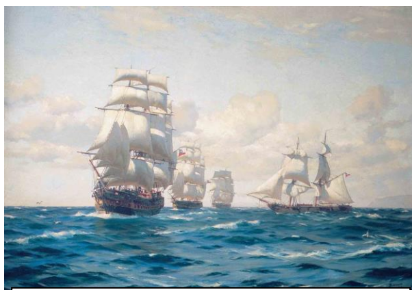
Armada de Chile, óleo de Thomas Somerscales

Sin embargo, otras acciones muy importantes de destacar han sido la realización de cursos de patrón de bahía y capitán deportivo costero en varias naos del litoral atrayendo a muchos tripulantes a navegar virtualmente y acercarnos cada vez al mar. También hay que mencionar el esfuerzo del hermano “Peluo” por divulgar sus interesantes teorías de navegación a vela. ¡Qué contentos deben estar nuestros Hermanos Fundadores observando desde el Mar de la Eternidad este amor al mar reflejado en estas acciones náutico-deportivas!