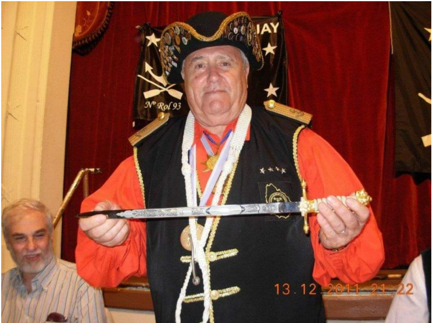
Gonzalo "Capitán Jambo" Dupont Hermano, ex Capitán Nacional de Uruguay