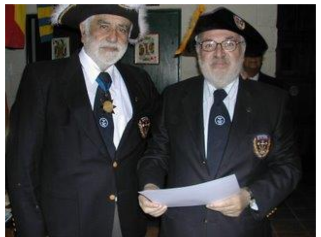
Imágenes del recuerdo de un gran amigo y Hermano de la Costa