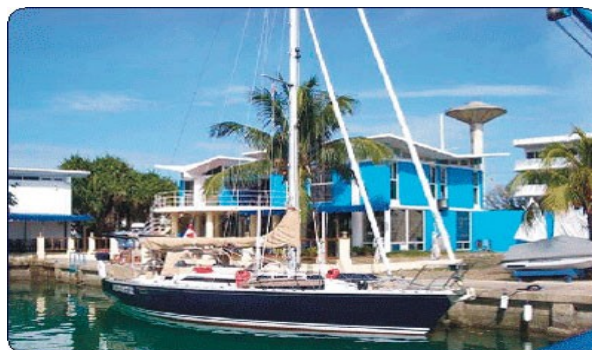
Fotografía de la sede del Club