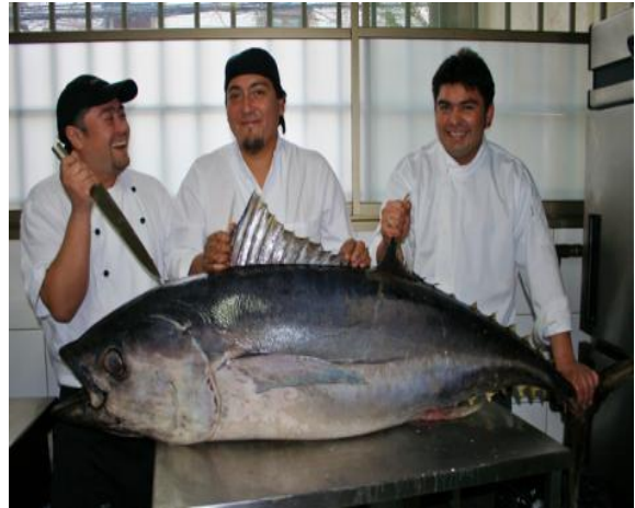
Atún de aleta amarilla de Rapa Nui.

Combatir la pesca ilegal no es fácil. La gran distancia hasta la costa y lo costosa que resulta la vigilancia hace que para los infractores merezca el riesgo. El primer paso es detectarlo. Para ello se usan fotos nocturnas de satélite que muestran las luces de grandes flotas en el borde de las zonas de exclusión económica. Oceana también está trabajando con Google y SkyTruth en un proyecto similar de posición satelital llamado Global Fishing Watch. Sin embargo, el mayor obstáculo es de carácter económico. Los vínculos entre ambos países son muy estrechos, e importantes.