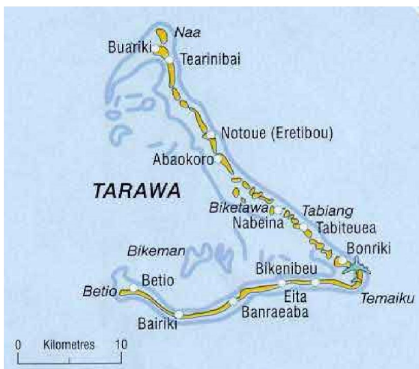
El atolón de Tarawa

El 20 de diciembre de 1943, durante la II Guerra Mundial, 4.601 japoneses, de los cuales 2.571 eran de la infantería naval, 2000 eran civiles que estaban construyendo una pista de aviación, y el resto eran mecánicos de la fuerza aérea, fueron atacados por 19.000 infantes de marina estadounidenses apoyados por 50 navíos, entre ellos 5 portaaviones y 3 acorazados, que desataron un infierno de bombas. La denominaron la Batalla de Tarawa, y fue llevada al cine con John Wayne. Cuando la vio, el presidente Harry Truman dijo: “Los marines tienen una máquina de propaganda más grande que la Stalin”.