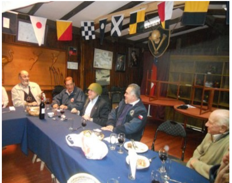
Hnos. Toñopalo, Titanic, Tai Fung, Diuquín y Taote

01 nov 2014. Gran ceremonia en la ciudad de Coronel y cóctel.