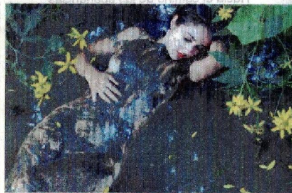
La estación de las flores lleva nombre de Mujer.

La Tertulia es una reunión de personas que se juntan a conversar con fines sociales o recreativos. Su raigambre data en Chile desde la Colonia pues la clase criolla se juntaba en casas y salones donde expandían sus horizontes literarios, culturales, musicales y se forjaban los románticos enlaces de las jóvenes parejas. Las Tertulias realizadas en Septiembre siempre estaban matizadas con aspectos patrios, así como aderezadas de espirituosas candelas, mistelas y guindados